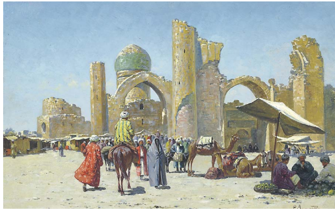
Одна из жемчужин Великого шелкового пути – Самарканд.