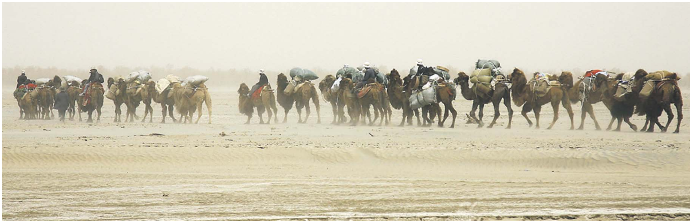
Одна из главных целей экспедиции – возрождение духа легендарного торгового пути.

Некоторые древние арабские географы считали, что Балтийское и Черное моря соединены морским проливом